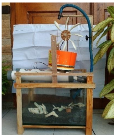
Gambar 1. Media aquaponik- induksi elektromagnetik

Berdasarkan pertimbangan seleksi alternatif di atas, jenis inovasi pembelajaran pada penelitian ini adalah menginovasi media pembelajaran dengan mempertimbangan indikator pencapaian literasi sains sebagai tujuan pembelajarannya. Sementara itu pembelajaran dikemas dalam pembelajaran berbasis proyek dan mengaitkan kegiatannya dalam lingkup STEM. Rancangan media aquaponik- induksi elektromagnetik sebagai berikut: