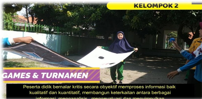
Gambar 5. Game dan Turnamen (kelompok 2)