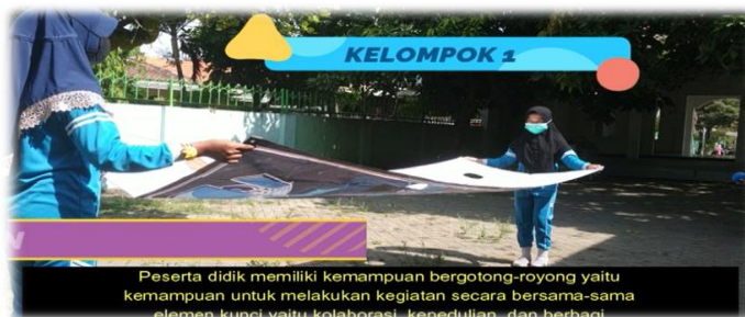
Gambar 4. Game dan Turnamen (kelompok 1)