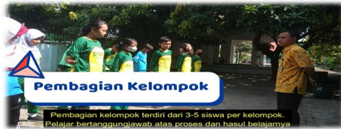
Gambar 3. Pembagian Kelompok