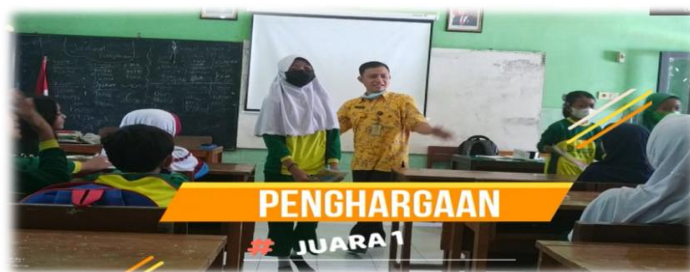
Gambar 6. Penghargaan/ reward