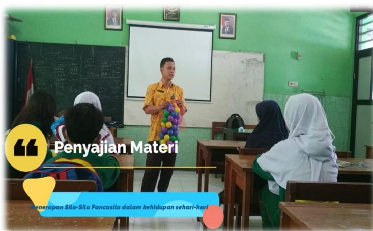
Gambar 2. Penyajian Materi

Tahap refleksi diperoleh informasi bahwa siswa sangat baik dalam memahami penerapan nilai-nilai Pancasila dalam kehidupan sehari-hari. lembar refleksi menunjukkan hasil sebesar 93%.