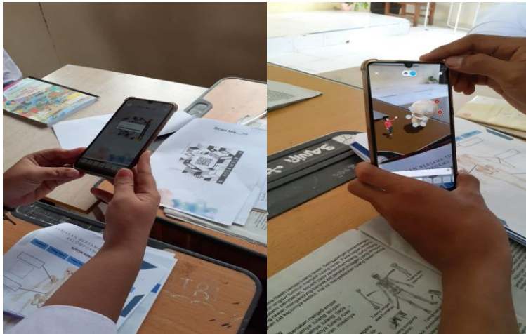
Gambar 3. Penggunaan Media Assemblr Edu

Siswa terlihat sangat antusias menggunakan media karena mereka dapat mengamati secara langsung dari berbagai sisi sehingga memudahkan siswa mempelajari materi, sesuai dengan pernyataan Fitri Sylvia dkk (2020), media Assemblr Edu memudahkan siswa memahami materi dalam bentuk objek 3D yang ditambahkan ke dalam dunia nyata dan siswa sendiri yang mengoperasikannya secara langsung melalui gawai miliknya. Setelah mengumpulkan dan mengolah data, dilanjutkan dengan tahap pembuktian, masing-masing kelompok mempresentasikan hasil diskusinya. Pada tahap pembuktian siswa menyandingkan data yang diperoleh dengan hipotesis yang sudah dibuat diawal apakah sesuai jika tidak sesuai siswa dibimbing mengidentifikasi ketidasesuaian antara fakta yang diperoleh dengan hipotesis. Pada tahap ini siswa dilatih untuk menganalisis, mengevaluasi dan menjelaskan. Setelah selesai pencocokan antara hipotesis dan data yang dikumpulkan maka siswa bersama guru menarik kesimpulan terhadap materi yang telah dipelajari. Diakhir siklus siswa melakukan tes untuk melihat peningkatan hasil belajar siswa, berdasarkan data hasil belajar siswa setelah Media Assemblr Edu mengalami peningkatan.