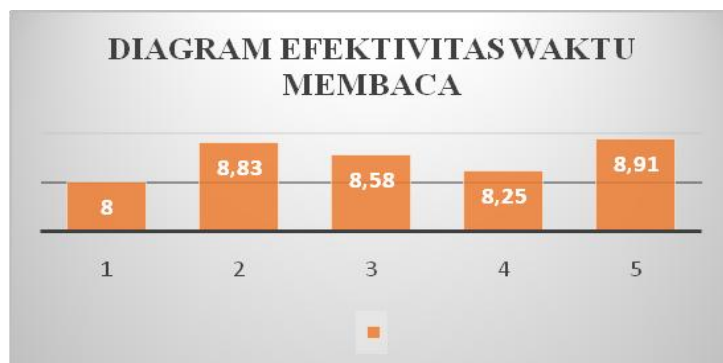
Diagram 1. Hasil Uji Kelas Kecil

Uji small group. Uji ini dikenakan pada 12 siswa dengan kemampuan heterogen untuk mengukur efektivitas waktu membaca materi dalam modul. Hasil uji pengukuran waktu membaca seperti pada diagram 2 menunjukkan bahwa rata-rata lama siswa membaca adalah 8,51 menit, termasuk dalam kategori baik.