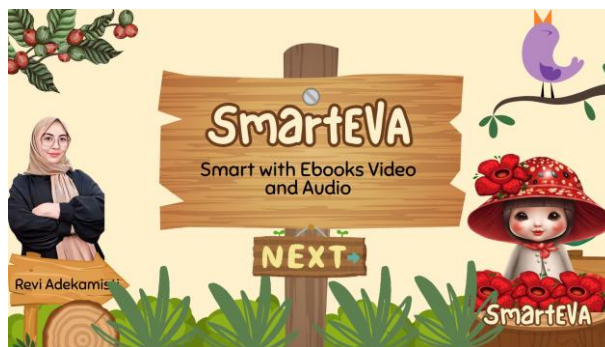
Gambar1. Halaman Depan Media SmartEVA

SmartEVA ( Smart with Ebooks, Video, and Audio ) dirancang sebagai solusi inovatif untuk mengatasi masalah ini. Sebagai media pembelajaran berbasis teknologi, dengan SmartEVA siswa dapat memilih bahan pelajaran yang sesuai dengan gaya belajar mereka misalnya ebook untuk gaya belajar visual, video untuk memberikan pemahaman berbasis ilustrasi, dan audio untuk memberikan penjelasan verbal. Dengan menggabungkan tiga media utama ini, SmartEVA diharapkan mampu membangun pengalaman belajar yang lebih inklusif dan adaptif. Platform ini dirancang berbasis web sehingga mudah diakses di perangkat sekolah, menjadikannya praktis untuk diterapkan dalam kelas yang memiliki berbagai kendala seperti keterbatasan waktu dan fasilitas. Berikut gambar tampilan SmartEVA yang diakses melalui platform berbasis web.