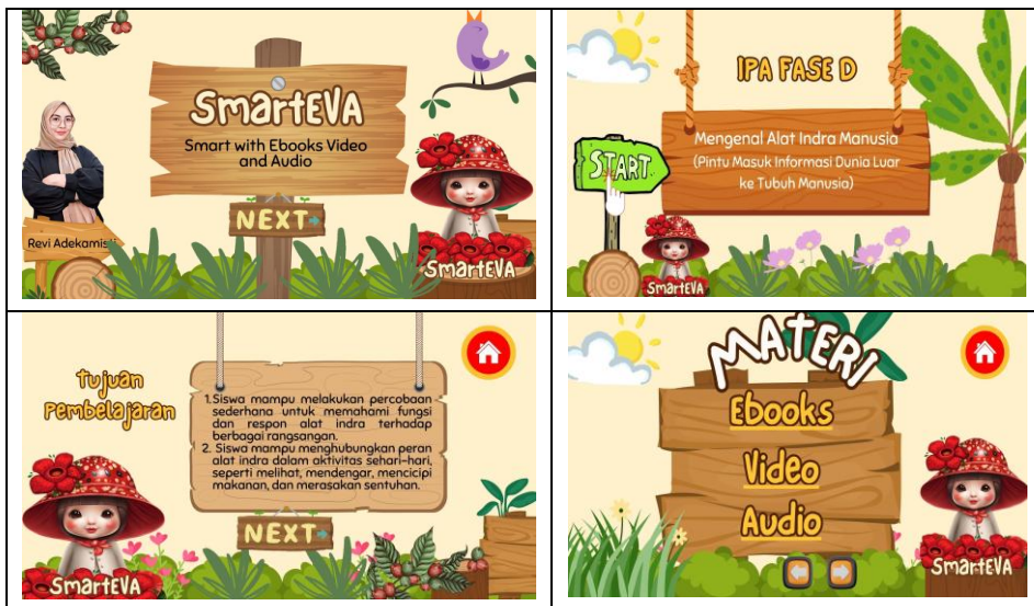
Gambar 2. Tampilan Media SmartEVA

Hasil belajar siswa diukur dengan menggunakan pre-test sebelum intervensi dan post-test setelah intervensi. Tabel di bawah ini menunjukkan rata-rata skor sebelum dan sesudah tes untuk setiap kelompok: