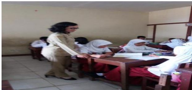
Gambar 4 Kegiatan Pembuka