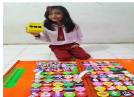
Gambar 5 Kegiatan inti