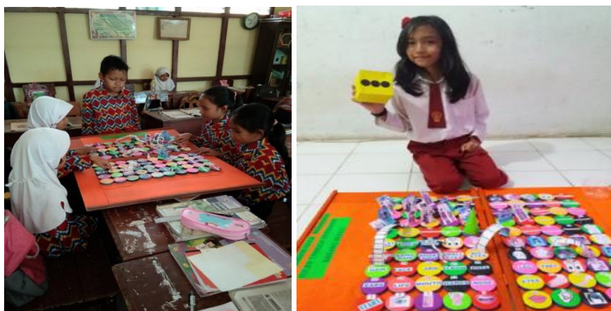
Gambar 3 Permainan Ular Tangga Berangkas

Penulis mengidentifikasi bahwa sebelum penerapan Media Permainan Ular Tangga Berangkas, siswa mengalami kesulitan dalam mendeskripsikan fisik seseorang dalam bahasa Inggris. Siswa sulit menentukan ciri-ciri fisik seseorang dalam bahasa Inggris karena kata-kata bendanya banyak dan penggunaan frase kata bendanya sering terbalik. Namun, setelah pembelajaran di kelas menggunakan media permainan ular tangga berangkas, siswa antusias dan senang, karena mereka dapat belajar bahasa Inggris sambil bermain. Mereka tidak monoton menghafal percakapan, tetapi berbicara bahasa Inggris sambil bermain.