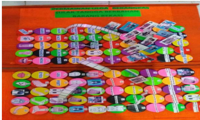
Gambar 2 Media Permainan Ular Tangga Berangkas

Langkah pembelajaran dengan menggunakan media permainan Ular Tangga Berangkas adalah seperti berikut: