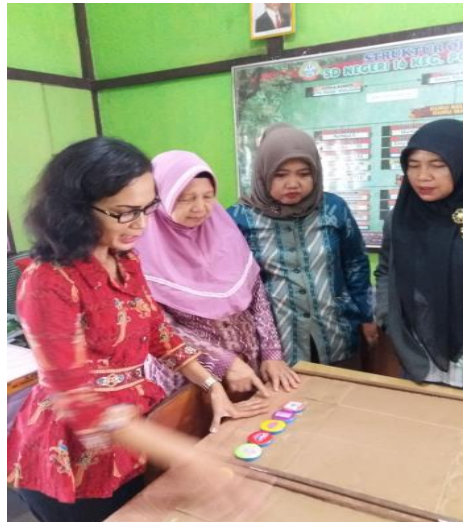
Gambar 7 Kegiatan pada sesi diseminasi

Media Ular Tangga Berangkas sudah didiseminasikan kepada teman sejawat dan mereka sangat antusias untuk melihat pembelajaran. Setelah dipaparkan penerapan media permainan Ular Tangga Berangkas, rekan - rekan guru merasa termotivasi untuk mencoba dan membuat media pembelajaran.