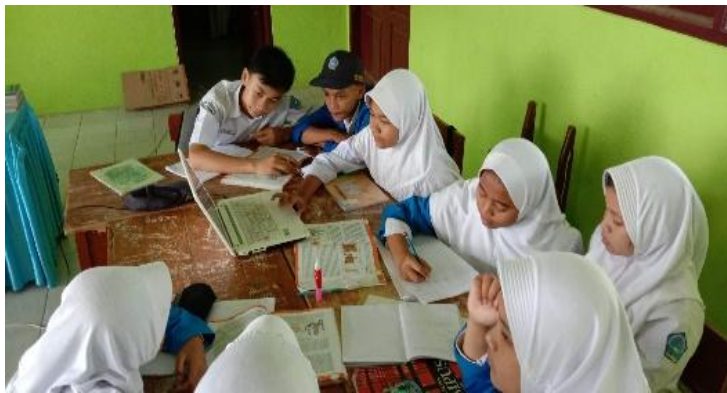
Gambar 4. Suasana saat Siswa Belajar pada Tahap Evaluation

Pada tahapan Evaluation , siswa diarahkan untuk mengevaluasi hasil pemodelan menggunakan aplikasi SimSketch . Format evaluasi pemodelan sudah tertera pada LKPD. Siswa menentukan beberapa coding yang berjalan dan coding yang tidak berjalan. Siswa menentukan solusi untuk coding yang tidak berjalan dan mengubahnya. Selain itu, siswa juga berkomunikasi dengan guru apakah pemodelan SimSketch cara kerja ginjal sudah sesuai dengan konsep sebenarnya. Jika tidak sesuai dengan konsep yang seharusnya, siswa mengubah pemodelan mereka sehingga memenuhi tuntutan konsep.