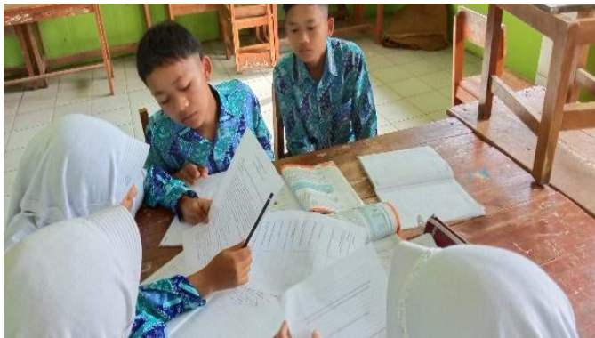
Gambar 2. Suasana saat Siswa Belajar

Kendala dan keterbatasan pada tahap decomposition . Kegiatan siswa diarahkan dengan Lembar Kerja Peserta Didik (LKPD). LKPD diawali dengan wacana yang mengandung permasalahan yang harus dipecahkan oleh siswa. Kendala yang dihadapi pada tahapan ini adalah ketidaksiapan siswa dalam menjawab setiap pertanyaan yang tertera pada LKPD. Hal ini dikarenakan siswa masih belum terbiasa bekerja secara mandiri dan melakukan diskusi kelompok. Dalam hal ini, guru dituntut untuk lebih telaten dalam membimbing siswa. Melalui bimbingan guru, siswa lambat laun dapat menemukan cara belajar mereka. Setahap demi setahap siswa dapat melalui kegiatan decomposition dengan bimbingan guru.