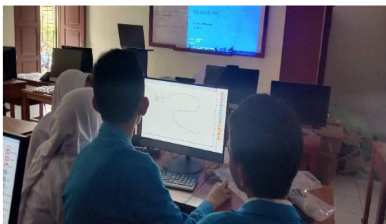
Gambar 3. Suasana saat Siswa Belajar pada Tahap Algorithmic Thinking

Hal ini dibuktikan dengan hasil angket yang mengungkapkan sebanyak 98% siswa sangat tertarik terhadap aplikasi ini. Dengan antusiasme siswa yang sangat tinggi menyebabkan mereka sangat mudah dalam mempelajari aplikasi ini. Siswa terampil membuat pemodelan dengan aplikasi ini walaupun guru hanya memberi satu kali contoh. Siswa terlebih dahulu membuat story board . Format story board sudah disediakan guru. Story board memudahkan siswa dalam menentukan setiap tahapan pemodelan menggunakan aplikasi SimSketch . Siswa membuat pemodelan cara kerja nefron ginjal. Siswa membuat pemodelan secara berkelompok. Kelompok siswa terdiri dari 2 orang anggota. Siswa bekerja di laboratorium komputer untuk membuat pemodelan. Waktu yang disediakan guru untuk membuat pemodelan tersebut adalah sebanyak 80 menit atau 2 jam tatap muka. Lebih dari 90% siswa dapat membuat pemodelan cara kerja nefron ginjal menggunakan aplikasi SimSketch .