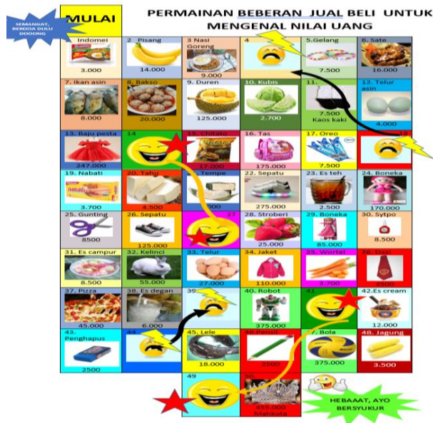
Gambar 1. Rancangan prroduk hasil pengembangan

Tahap ke empat adalah tahap Implementation or Delivery yaitu pengembangan media beberan jual beli dalam dilakukan di kelas 5 tunarungu dengan 8 kali pertemuan , semua anak di beri keempatan melakukan permainan sebanyak 20 kali dengan menilai aktifitas dan kecakapan literasi numerasi siswa. Ini dilakukan pada tanggal 31 Agustus sampai dengan 21 September 2021. Untuk hasil analisis uji efektifitas diperoleh rerata 68,69 pada A, 25,5 pada TA dan 3,75 pada P. sedangkan untuk uji literasi numerasi diperoleh rerata sebesar 59,19 pada A, 32 pada TA, dan 8,44 pada P.