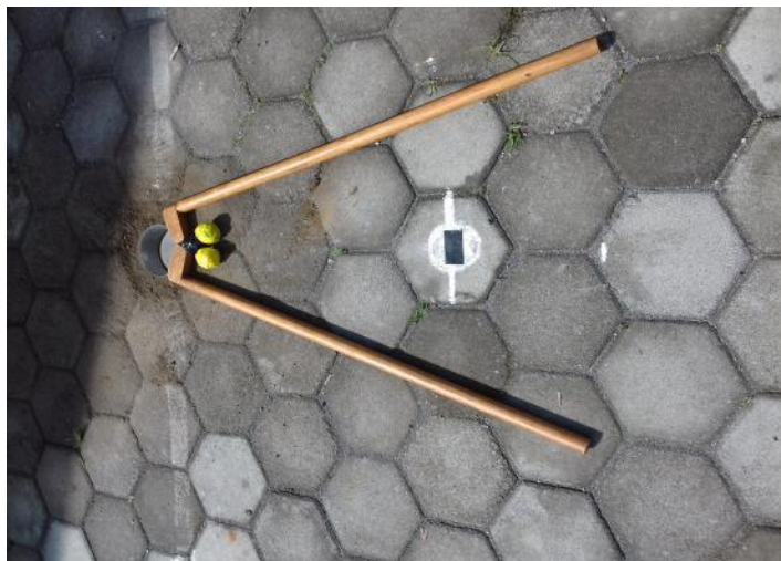
Gambar 1: Alat Pemukul

Jenis rancangan karya inovasi yang berdasarkan pada ide dasar diatas, maka dibuatlah inovasi pembelajaran untuk meningkatkan hasil belajar gerak dasar manipulatif dengan permainan balistik. Balistik merupakan singkatan dari bola plastisin dan stik kayu. Yang berarti bola 156lastic yang diisi dengan plastisin. Sedang yang dimaksud stik merupakan alat pemukul terbuat dari kayu yang sudah didesain sedemikian rupa sesuai dengan fungsinya.