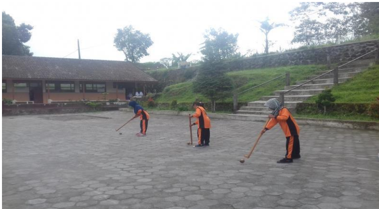
Gambar 3: Pukul Bola Berpasangan

Siswa atau sisI berdiri saling berhadapan dengan pasangannya dengan masing-masing siswa memegang stik, putar badan ke kanan 90 derajat, condongkan badan dengan sedikit menekuk lutut, ayunkan stik/pemukul dan pukul bola ke arah pasangannya, latihan dilakukan secara berulang-ulang.